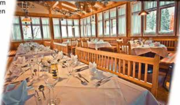
SALETTL (bis 53 Personen)