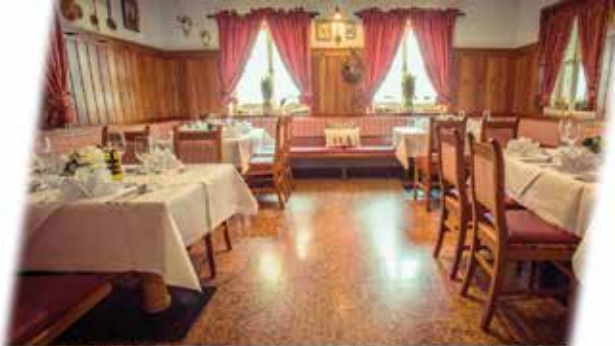
JAGDSTUBE (bis 28 + 9 Personen)

Nicht zu vergessen ist unsere Sonnenterasse, die dem „DaxLueg“ das gewisse etwas verleihen. Diese Dingen lassen sich zwar nur schwer beschreiben, aber Sie werden schnell merken, was wir meinen.