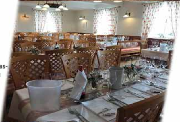
ROSENSTUBE (bis 88 Personen)